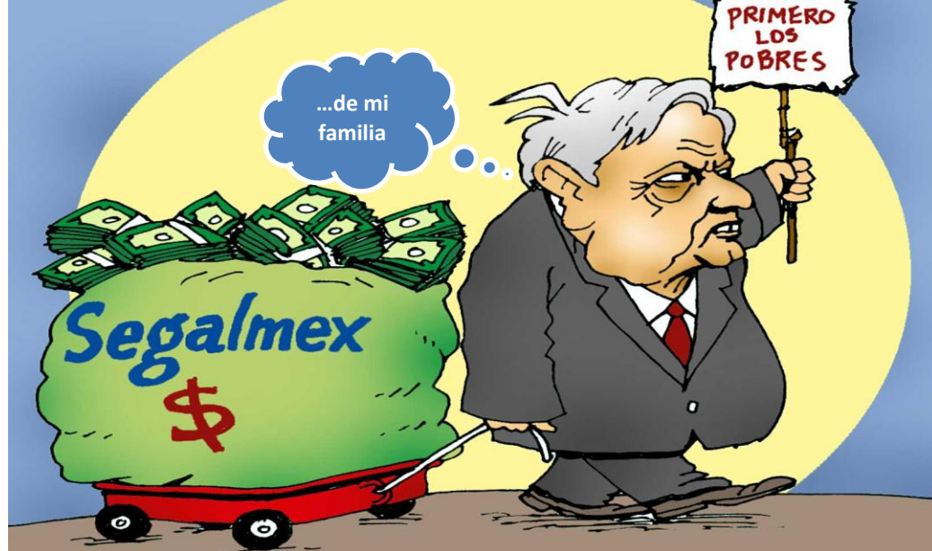
El gobierno de AMLO tuvo un desfalco de 417,000,000,000 de pesos. ¿Habrá impunidad?

Y, más ridículo que triste, es exigir disculpas a quienes no cometieron las injusticias, en nombre de victimarios y víctimas que ya murieron, como en la conquista. Basta de quejarse del pasado ajeno e irremediable. Lo que hay que combatir es el sistema de injusticias, impunidades y elitismos que hoy los criminales heredan a sus hijos para perpetuar los privilegios. ▀