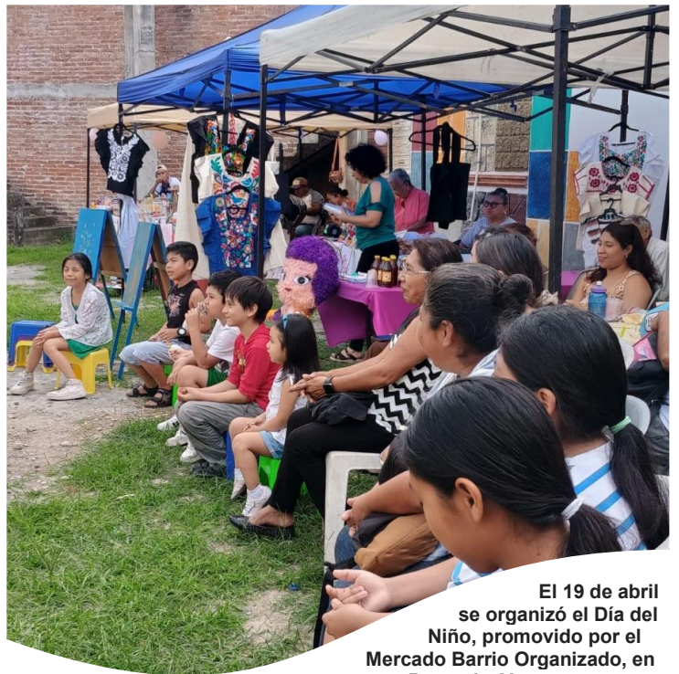
El 19 de abril se organizó el Día del Niño, promovido por el Mercado Barrio Organizado, en Papantla, Ver.