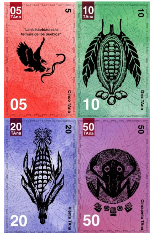
Diseños de Ulyses

Ésta será la primera emisión de ANA$, para la cual existe otro conjunto de diseños que también serán impresos. Su forma de funcionamiento será muy parecida al Túmin y actualmente se encuentra en consulta los detalles de su funcionamiento. ▀