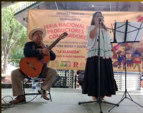
Duetto Oscar (Boleros del recuerdo)