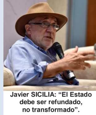
Javier SICILIA: “El Estado debe ser refundado, no transformado”.

El poeta Javier Sicilia advierte que con la presidenta Claudia Sheinbaum “no hay esperanza” y que su gobierno profundiza la crisis de violencia. En el marco de los 15 años del Movimiento por la Paz con Justicia y Dignidad (MPJyD), sostiene que la violencia en México no sólo persiste, sino se ha profundizado en un contexto de debilidad institucional, impunidad y un Estado incapaz de juzgarse a sí mismo.