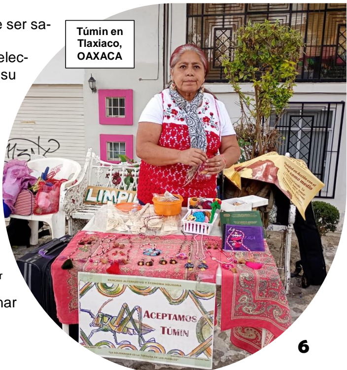
Túmin en Tlaxiaco, OAXACA