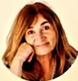
Mar Alonso Naturópata

3ª MESA: 13:00 a 14:25 - Tratamientos II y debate