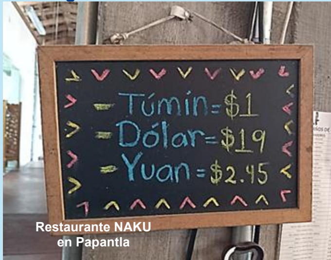
Restaurante NAKU en Papantla

Un Túmin equivale a un peso y a la unidad de cualquier moneda del mundo.