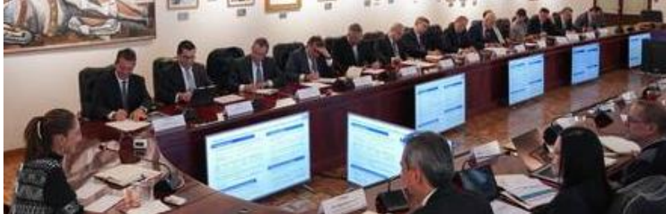
Sheinbaum: Demagogia socialista con prácticas capitalistas.

He aquí tres estrategias para sanar un país de almas enfermas. ▴