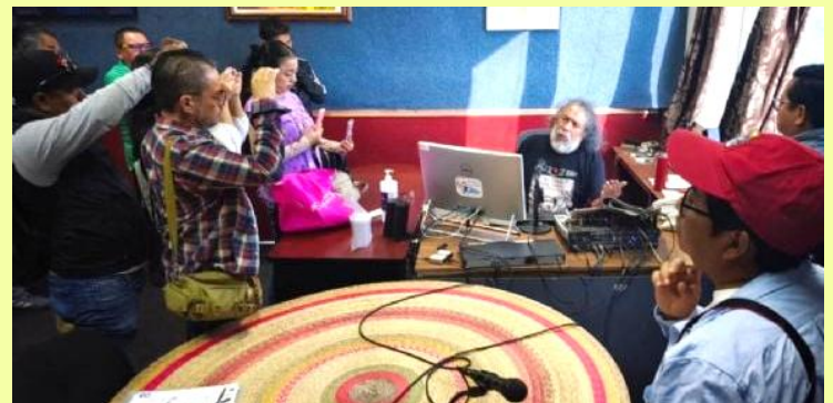
Reporteros en la cabina de Radio Universidad-Pueblo.

LUIS DANIEL NAVA, Proceso , 21 de enero de 2026 (Resumen)