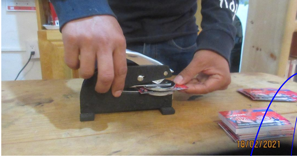
Sello de relieve del Túmin Oaxaca