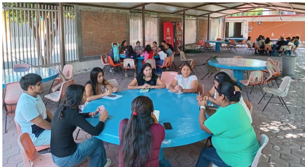
Trabajo en equipos