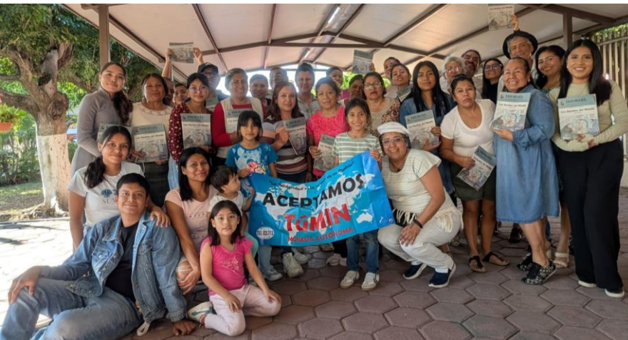
20 nuevos tumistas en Cuautla, Morelos