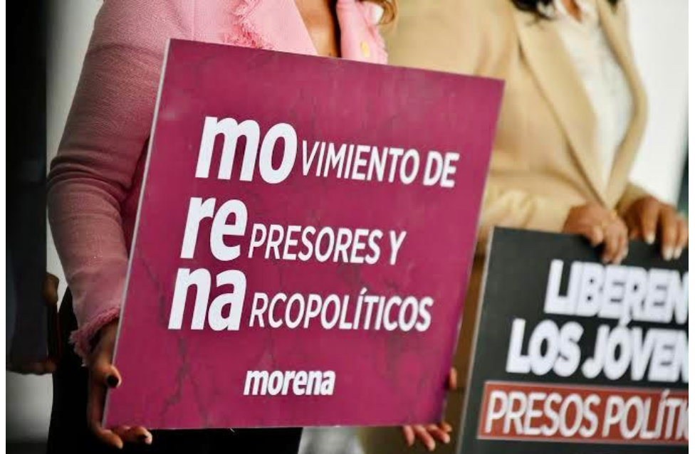
Ecos de la marcha 15N

¿Podemos posponer nuestros intereses particulares o de gremio por un objetivo común? ¿por México? ▴