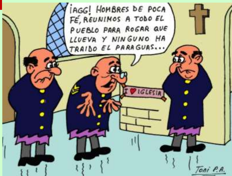
Juan creía en el bautismo. Jesús creía en la fe.

Jesús no hacía rituales ni quería hacer milagros; la gente se curaba por su propia fe: "tu fe te ha salvado".