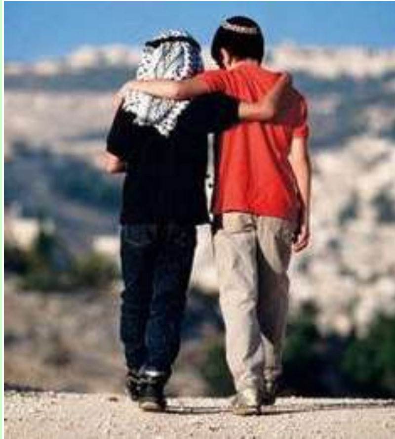
El milagro no era magia, sino un acontecimiento excepcional.

Ninguna otra cosa evidencia con mayor claridad cuan