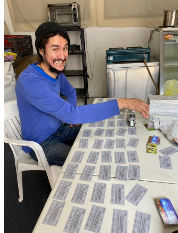
Fabricando dinero autónomo

Los Tumins Tenoxcas constan en la parte frontal la palabra “Tumin” sin la tilde como se pronuncia en Náhuatl, la palabra “Tenoxca”, su número arábigo o denominación, con la palabra escrita de significado en náhuatl, diseño validado