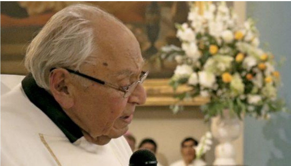
Gustavo Gutiérrez, considerado el padre de la Teología de la Liberación