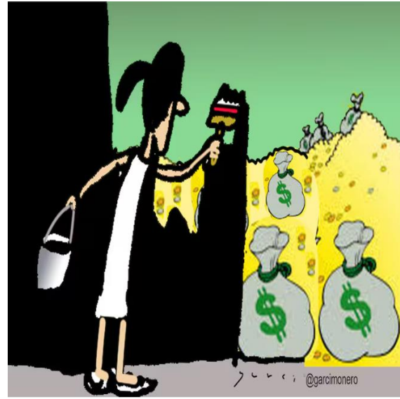
Transparencia y “seguridad nacional”

La pseudo-presidenta Sheinbaum informó que el Ejército sólo disparará en defensa propia . Es decir, a los demás mexicanos que se los lleve el tren maya. ▀