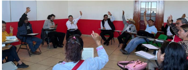
Salida alternativa: Nuevas asambleas municipales de Autogobierno . Ahora en Jilotepec, Estado de México, el 10 de noviembre.

No hay salidas. México está acorralado por arriba con el poder ejecutivo y toda su soberbia; abajo por el legislativo embriagado de poder; por un costado el virrey judicial fiel al mejor postor; por otro un artículo 41 Constitucional que nadie propone derogar, partidos por todos los frentes; instituciones