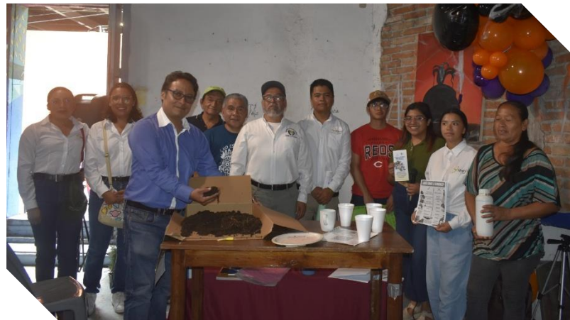
Estudiantes de la Universidad de Chapingo dieron un taller en Papaachama.