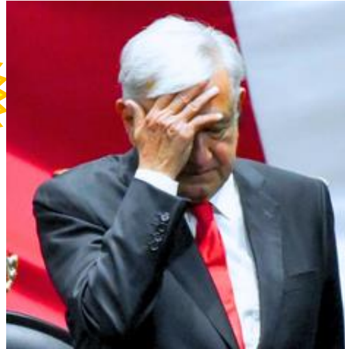
Auditoría Superior: Fraude

Esto implica una paradoja, ya que conforme aumentan los montos con anomalías, van a la baja las acciones de la ASF para corregir o castigar las prácticas ilegales. ▀